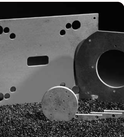
Materiales aislantes HT para temperaturas de trabajo por encima de 300 °C

La base de nuestras promesas de calidad y de servicio es nuestra competencia, con más de 20 años de experiencia en el tratamiento y la elaboración de materiales aislantes. Conocemos los requisitos del mercado a la perfección. Tanto del lado de los fabricantes de maquinaria e instalaciones como del lado de los usuarios en muchos sectores.