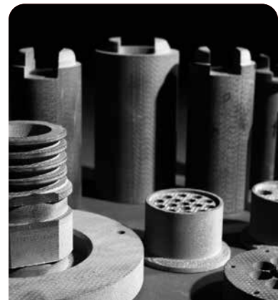
cosTherm® Elementos constructivos para maquinaria